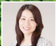
ナレーション 木村 さおり