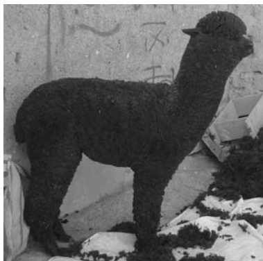
図 2 ワカヤ、有色

南米ラクダ科動物には 4 種類あり、そのうちリヤマとアルパカが家畜化されており、ビクーニャとグアナコが野生種である。リヤマは、野生種ではグアナコに近遠性を示しており (川本 2007: 380)、4 種の中で最も大きく、体長 175~225cm、