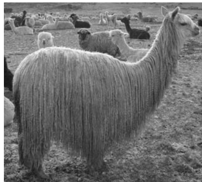
図 3 スリ、白色

体高およそ 90~125cm、体色は白、茶、黒、灰があり、多色や斑も多い。肉、毛と荷駄獣としての利用が主である。毛の量が少ないカラ ( k'ara ) と多いチャク ( chaku ) に区別される。アンデス諸国におけるリヤマとアルパカの頭数では、ペルーとボリビアの 2 国が突出しているが、ペルーではアルパカがリヤマの 2.5 倍以上なのに対して (アルパカが約 250