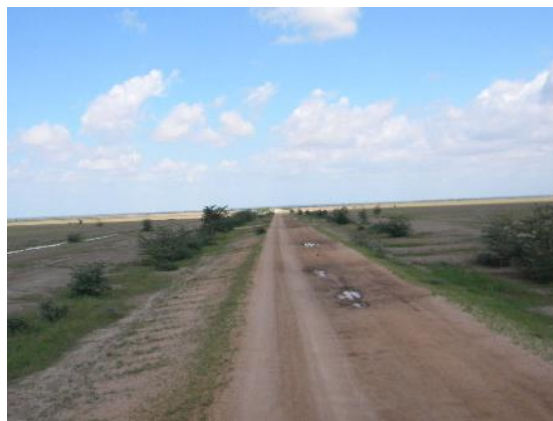
図3 北ケニアの道路

さらに、北ケニアでは道路網が整備されてからも、ラクダは単なる移動以外の目的で利用されつづけた。一例を挙げると、ラクダはケニア警察隊 (Kenya Police) と部族警察隊 (Tribal Police) が道路の通っていない牧野で不法に放牧地が利用されていないか巡察するのに用いられていた 23 。また、行政官が徒歩で自分の管轄地域を巡回する際にも、ラクダは使役された。「旅行」を意味するスワヒリ語から「サファリ (safari)」と呼ばれたこの巡回において、行政官は人びとと直接コ