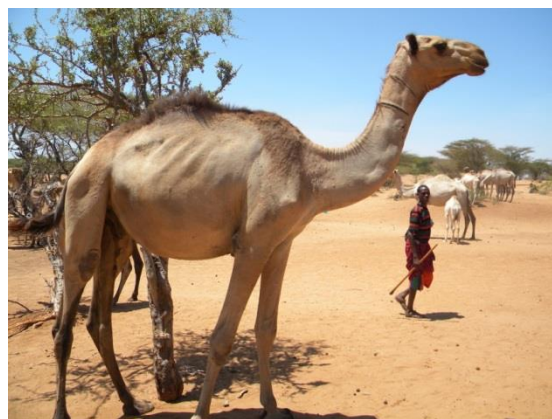
図2 ラクダと牧夫

以上の問題意識を踏まえた上で、本論では、20世紀前半のケニア北部乾燥地域を対象として、この地域で利用可能な資源のひとつであるヒトコブラクダ ( Camelus dromedarius ) をイギリス植民地統治がどのように評価・利用していたのか、を見ていく(図2)。ソマリ(Somali)やガブラ(Gabra)、ボラナ(Borana)といった東クシ系や、トゥルカナ(Turkana)やサンブル(Samburu)などの東ナイル系の諸民族が暮らすこの地域において、ラクダは彼