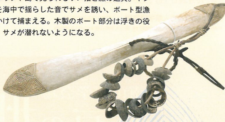
○棍棒（部分） 現地名：MOUNGALAULAU トンガ

ニューアイルランド島で見られるサメ招きの道具。ヤシ殻付き漁具を海中で揺らした音でサメを誘い、ボート型漁具の輪縄をかけて捕まえる。木製のボート部分は浮きの役割を果たし、サメが潜れないようになる。