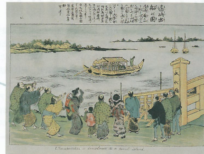
●古今御仕置書（江戸後期）

旧幕府時代における犯罪の発生、犯罪容疑者の検挙、取調べ、収監、裁判、処刑を描いた 63 点の図版を収録。当時の刑罰を「惨刑」と表現し婦女子の通覧に耐えないものとするなど、批判的な意思が見てとれる。