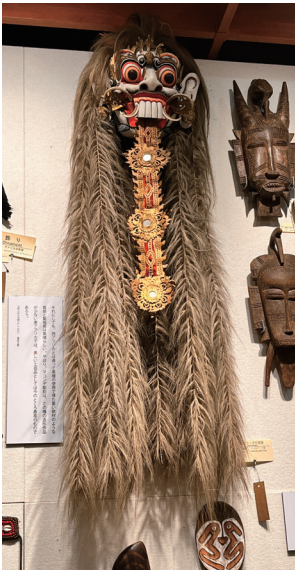
4位：魔女ランダの仮面 49票