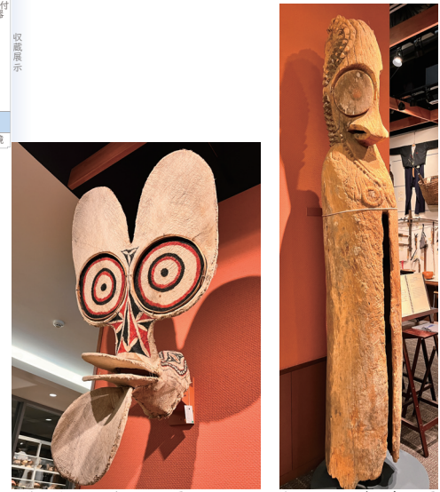
2位：火踊りの仮面 69票