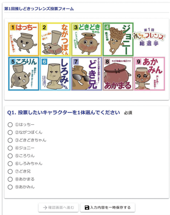
画像2 Web投票フォーム