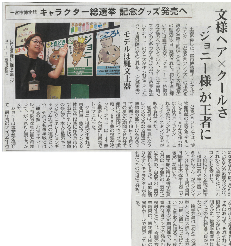
画像8 「選挙結果」新聞記事（中日新聞 2025年9月17日朝刊 尾張面）