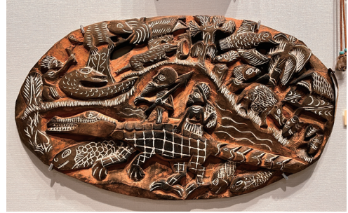
9位：ストーリーボード 24票