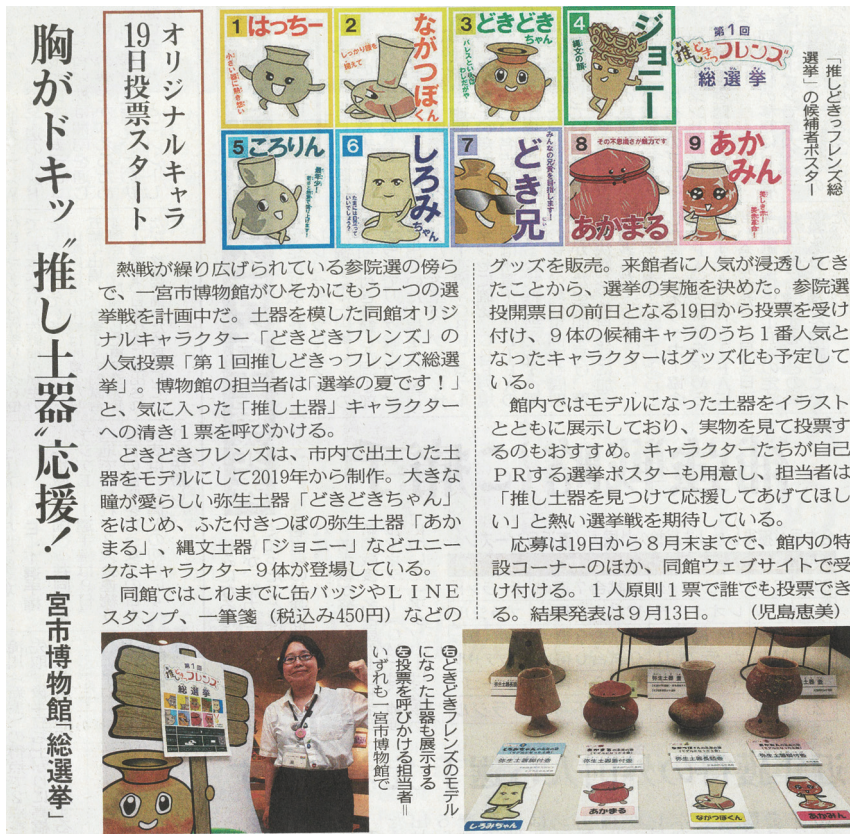
画像7 「総選挙開催」の新聞記事（中日新聞 2025年7月10日朝刊 尾張面）