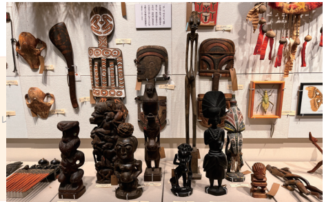
8位：抽象彫刻／人像 32票